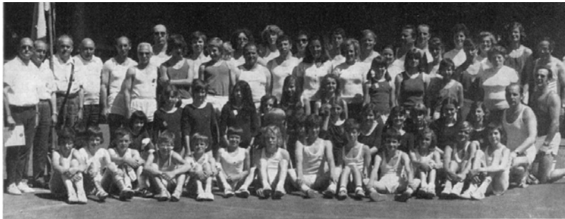
Die Vereinsriege beim Deutschen Turnfest 1973 in Stuttgart

Der Verein bewies im Wechsel der Zeiten ein zähes Leben. Möge er stets von treuen Idealisten und hilfsbereiten Helfern auf seinem weiteren Weg begleitet werden und die innere Kraft aufbringen zur jeweiligen Anpassung an die Veränderungen der Zeit und zur weiteren Arbeit zum Wohle des Volksganzen.